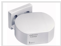
müller FU 20.00 pro