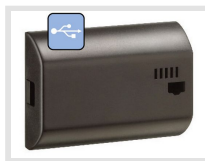
PP 50.00 pro